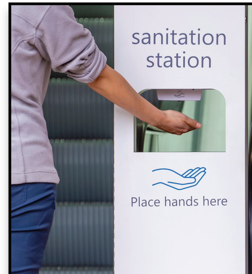
Sanitizing Stations in High-Touch Areas Estaciones de desinfección en áreas de alto contacto