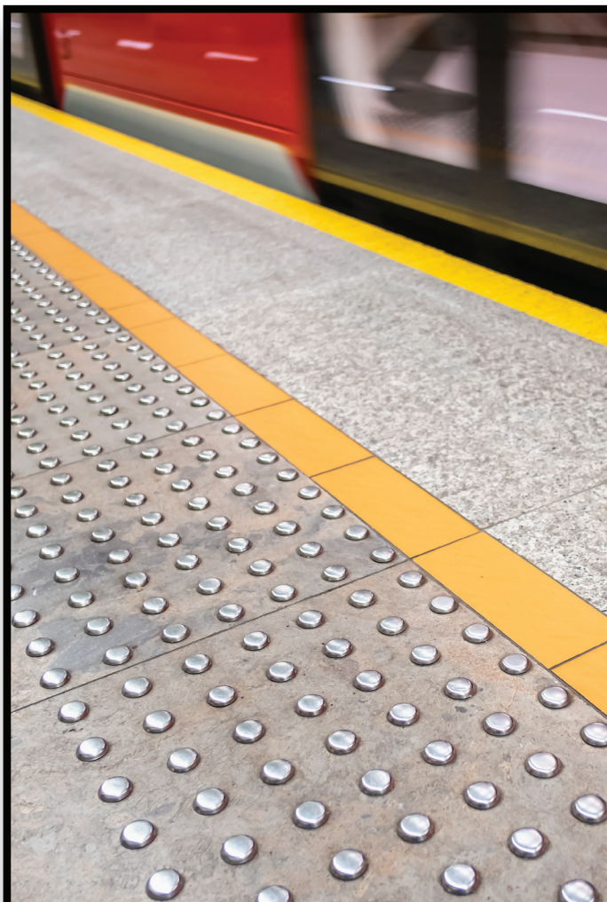
Tactile Paving Pavimento táctil