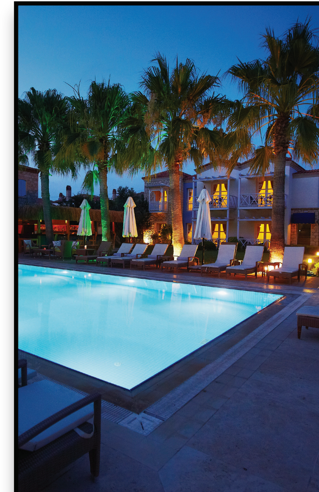
Hospitality & Lodging Hospitalidad y alojamiento