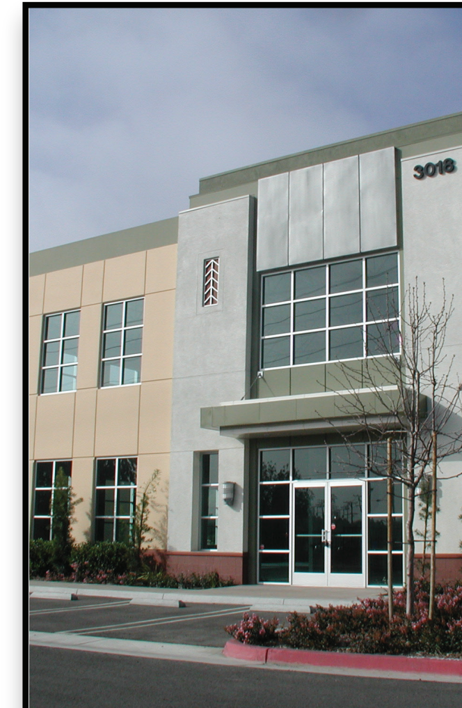
Office & Employment Oficina y empleo