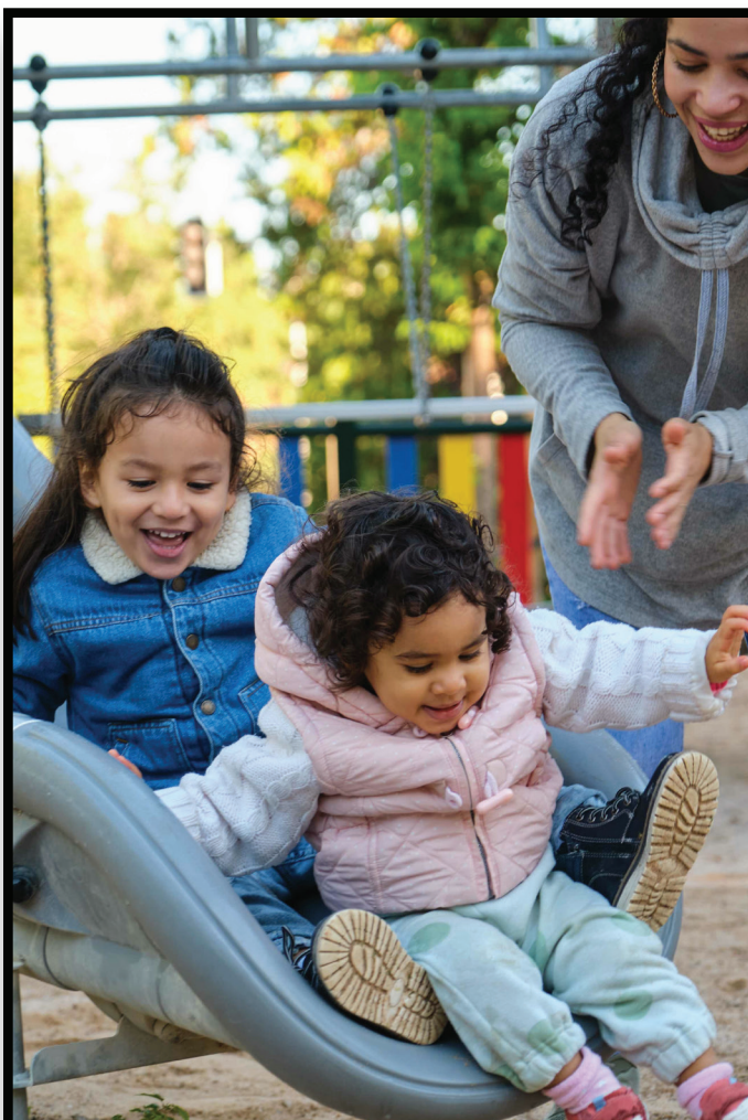
Children's Play Area Área de juegos para niños