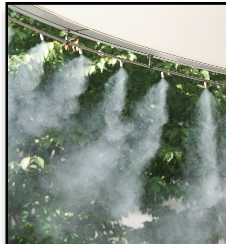
Extreme Weather Protection Protección contra condiciones climáticas extremas