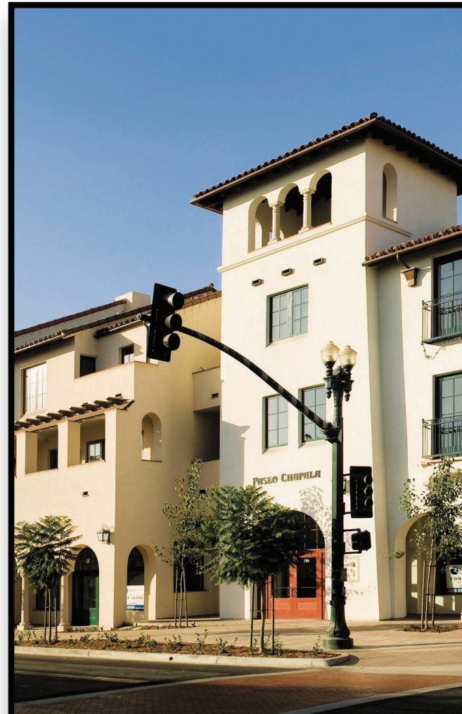
Mixed-Use Residential and Retail Uso Mixto Residencial y Comercial