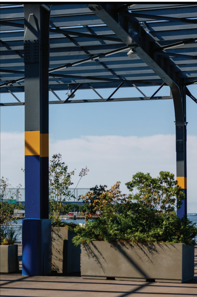
Shaded Waiting Areas Áreas de espera con sombra

¿Cuáles características harían que el área de la estación fuera más accesible y mejor integrada en la comunidad? Seleccione sus tres características principales.