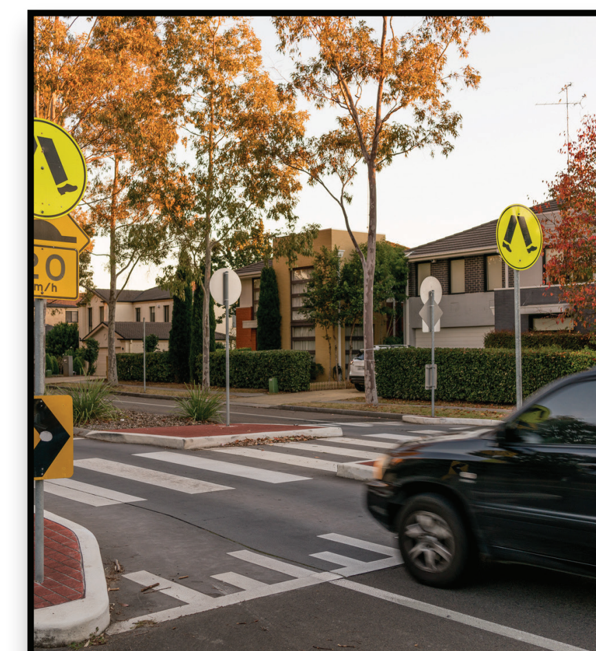
Traffic Calming Measures Around the Station Medidas de reducción de velocidad alrededor de la estación