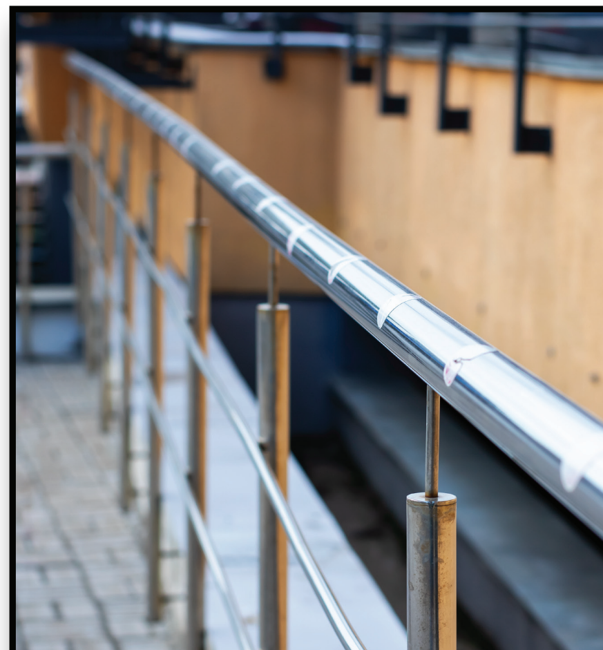
Platform Safety Barriers Barreras de seguridad en la plataforma