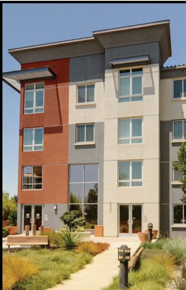
Multi-Family Housing Vivienda multifamiliar

¿Qué tipos de edificios o espacios complementarían el área de la estación y la comunidad circundante? Seleccione sus tres características principales.