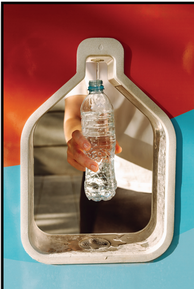
Water Refill Station Estación de recarga de agua