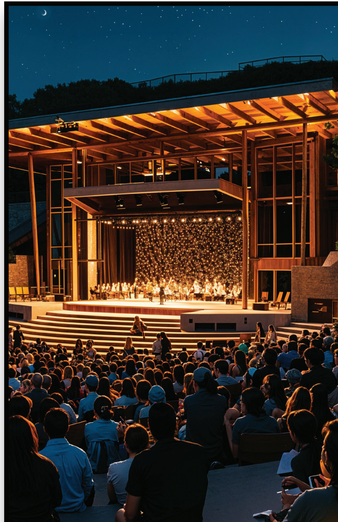
Cultural & Entertainment Cultura y entretenimiento