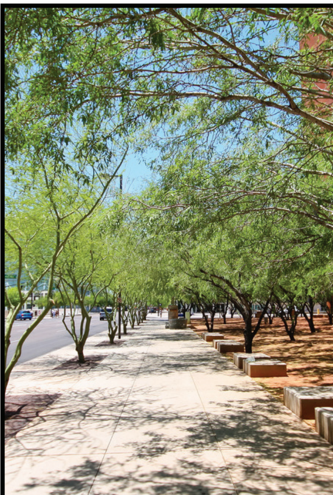
Direct Pedestrian Access from Downtown Coachella (El Pueblo Viejo) Acceso peatonal directo desde el centro de Coachella (El Pueblo Viejo)