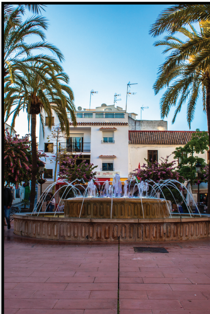
Community Space Espacio comunitario