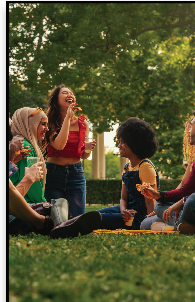
Open Space Espacio abierto