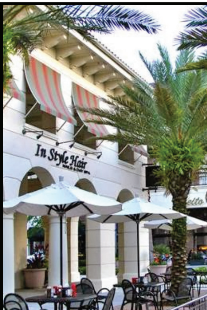
Station Within a Short Walk of Downtown Shops and Restaurants Estación a un corto camino de las tiendas y restaurantes del centro