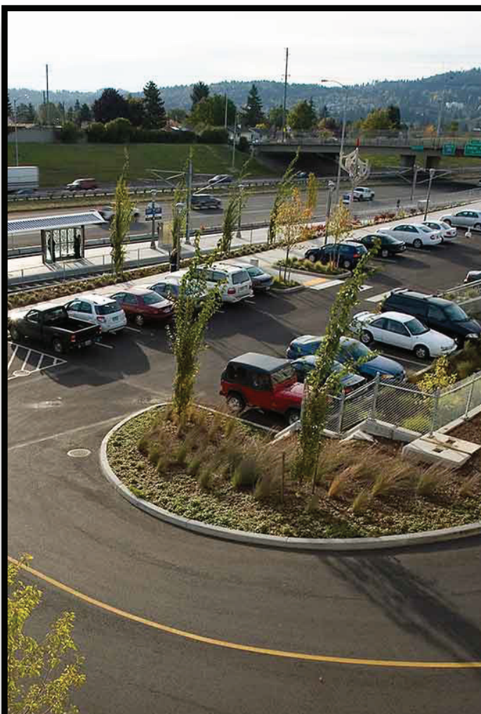
Park & Ride Aparca y Viaja