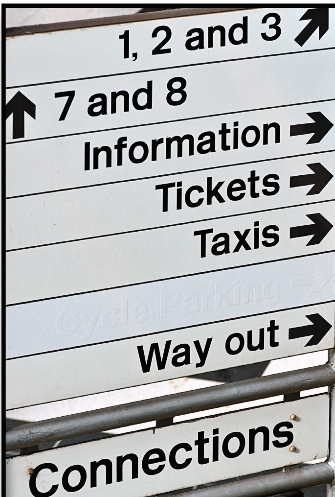
Wayfinding Signage Señalización de orientación