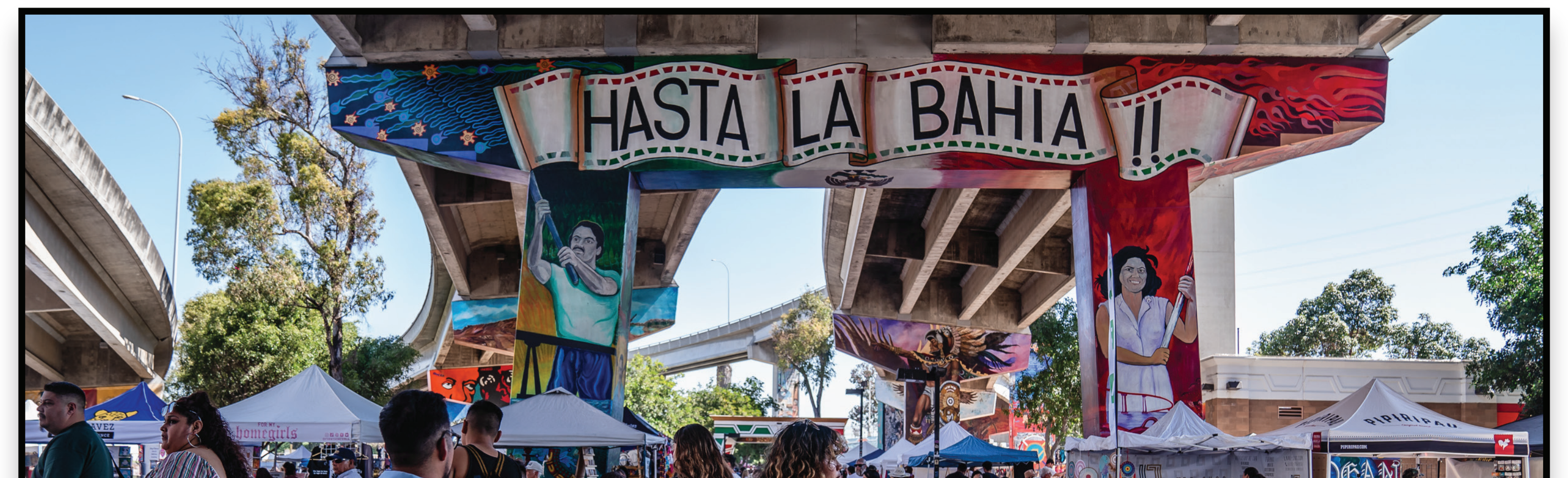
Chicano Park Trolley Stop / Parada del tranvía de Chicano Park