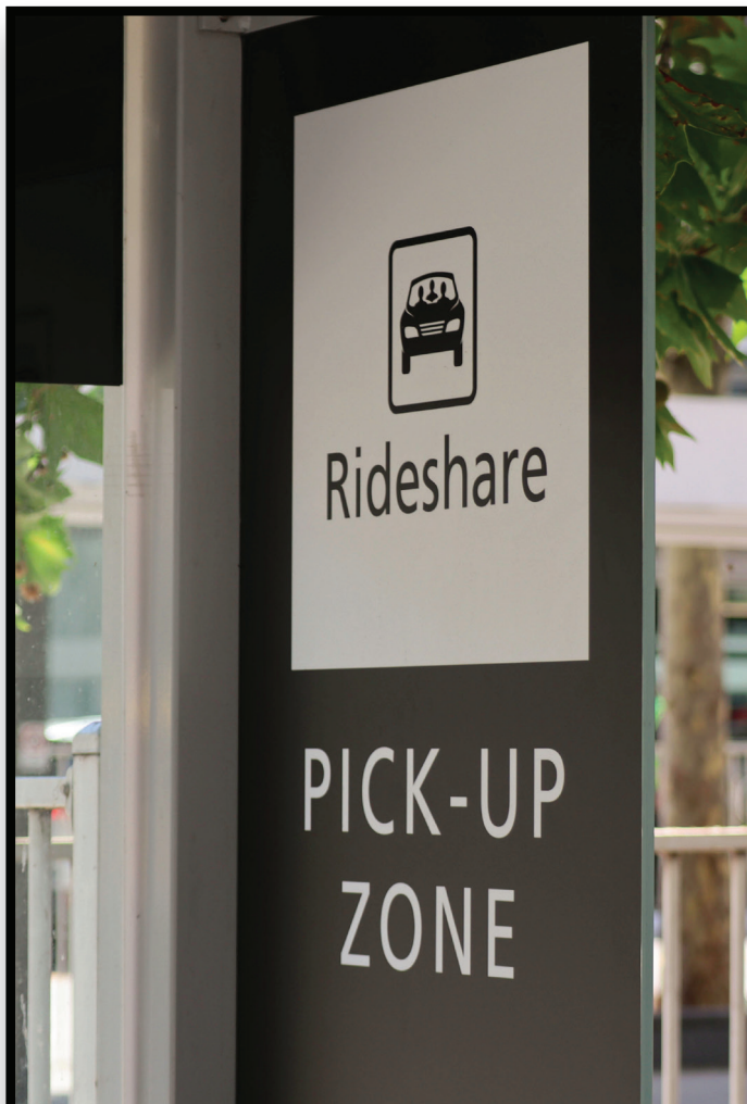
Rideshare & Drop-off Zones Zonas de transporte compartido y descenso de pasajeros