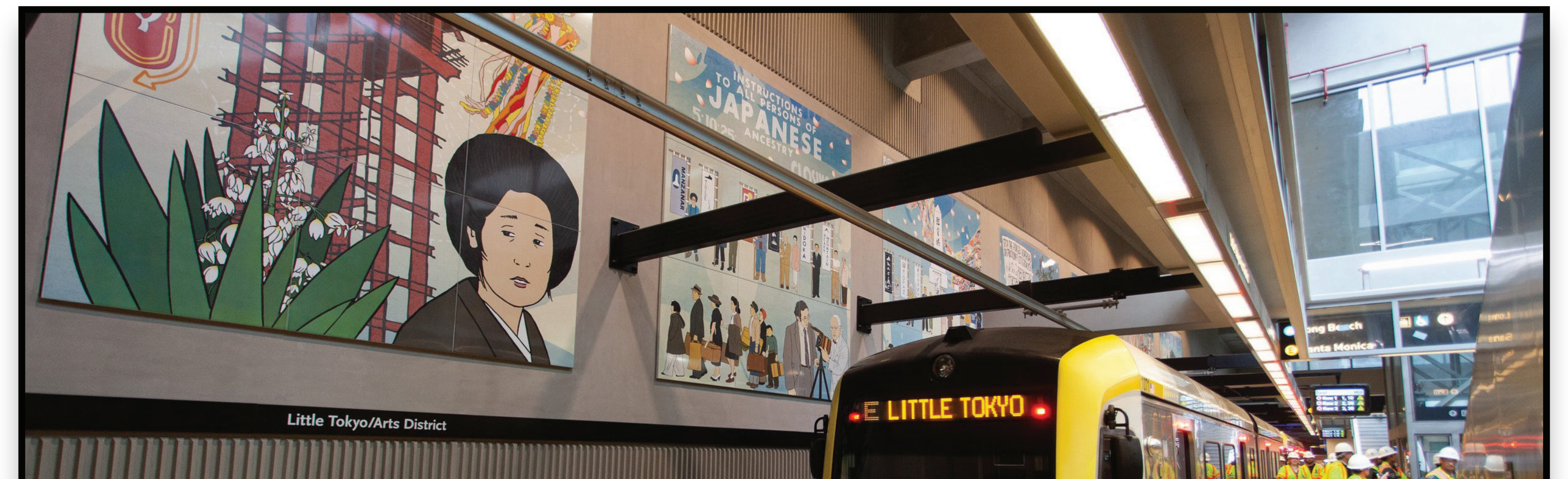
Little Tokyo Arts District Station / Distrito de las Artes de Little Tokyo