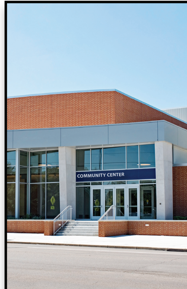
Civic & Institutional Cívico e institucional