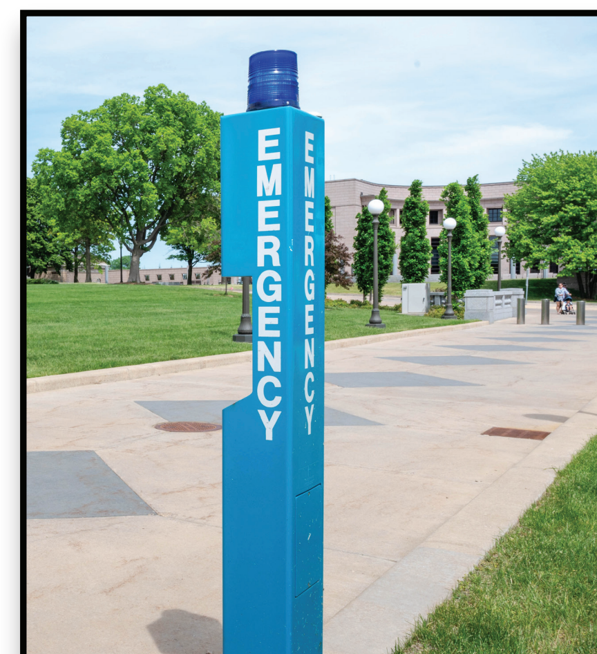
Emergency Call Stations Estaciones de llamada de emergencia