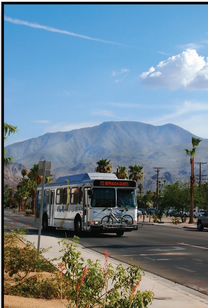
Bus Connections Conexiones de autobús