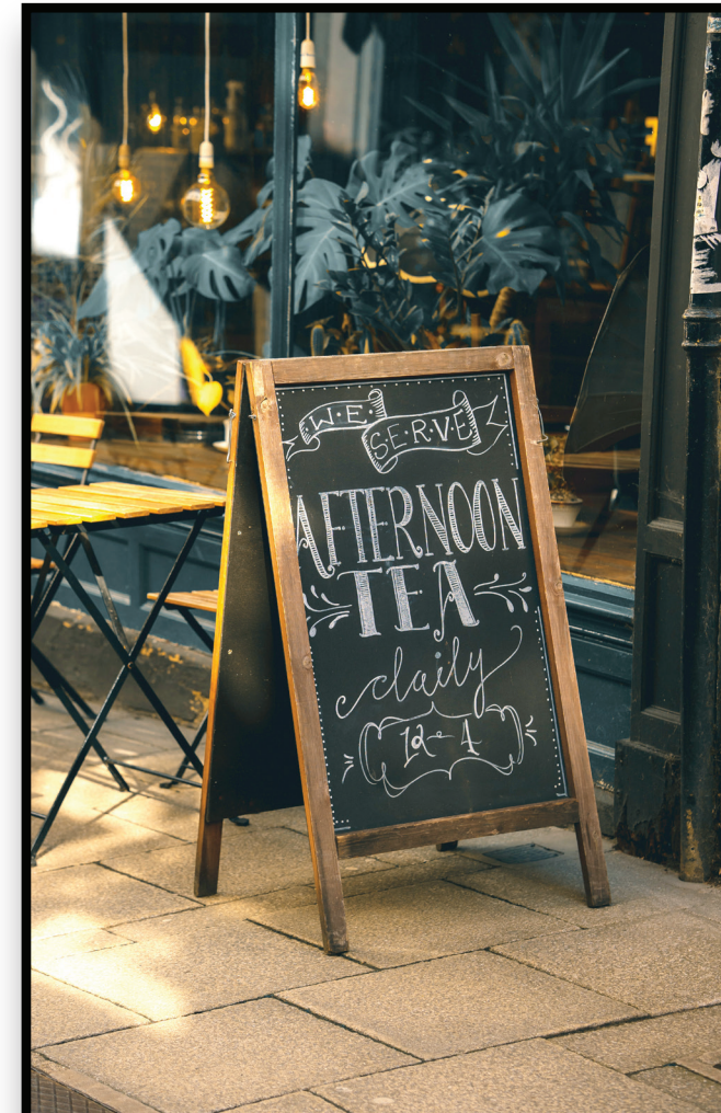
Coffee Shops & Boutiques Cafeterías y boutiques