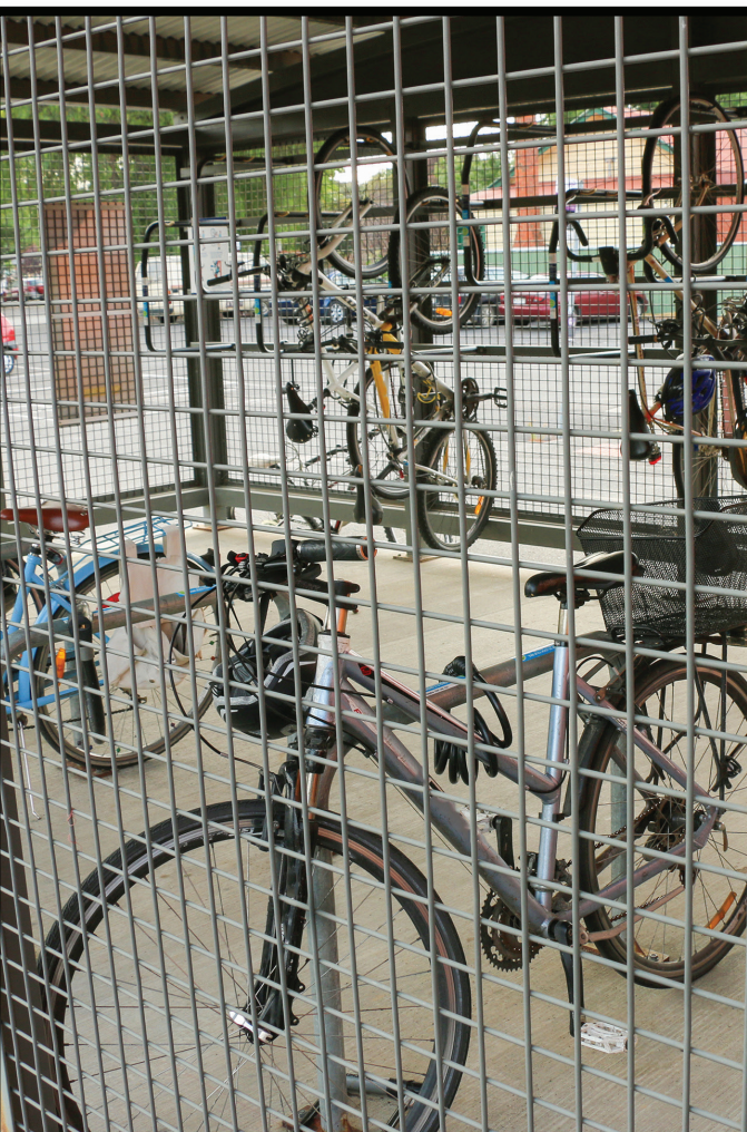
Bike Parking & Storage Estacionamiento y almacenamiento para bicicletas

¿Cuáles características harían que el área de la estación fuera más accesible y mejor integrada en la comunidad? Seleccione sus tres características principales.