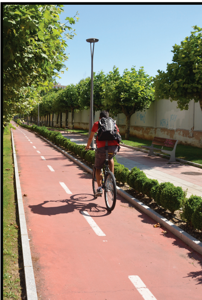
Bikeways & Pedestrian Paths Carriles para bicicletas y caminos peatonales