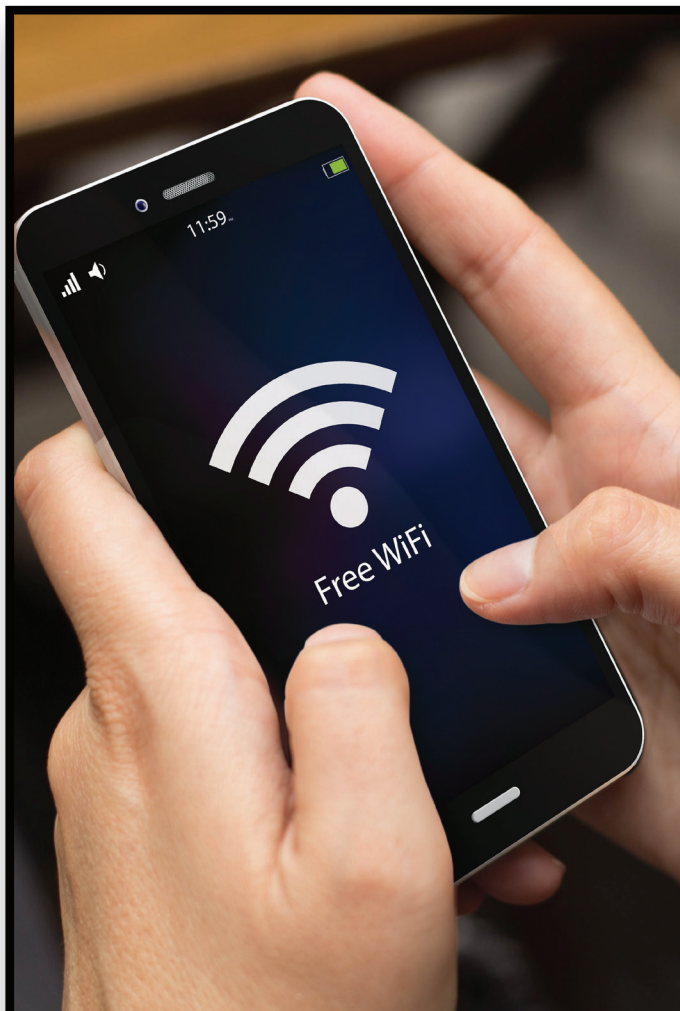
Wi-Fi Access Acceso a Wi-Fi