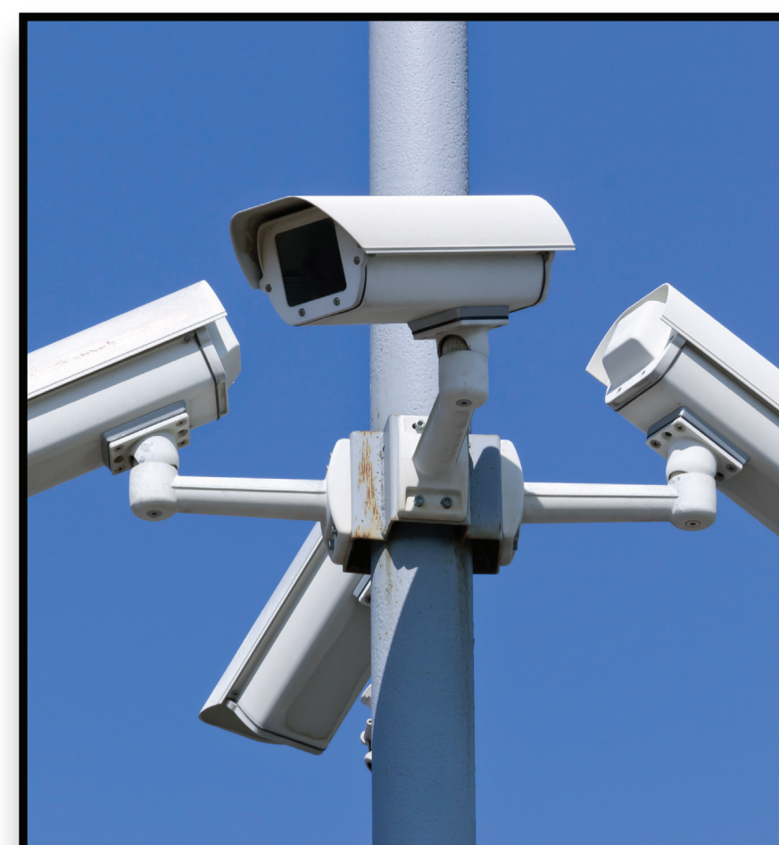
Security Cameras Cámaras de seguridad