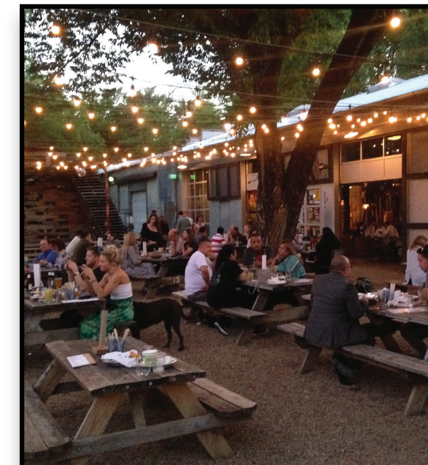
Active & Lively Area Into the Night Zona activa hasta la noche