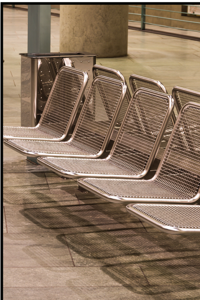
Seating Areas Áreas para sentarse